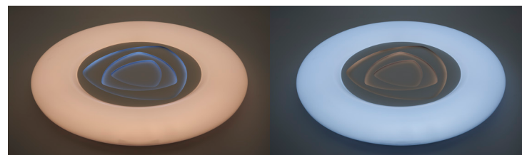
Контрастное свечение внешней и внутренней части светильника в режимах 2700K и 6400K

Стильный дизайн, который подойдёт для любого интерьера и типа помещения.